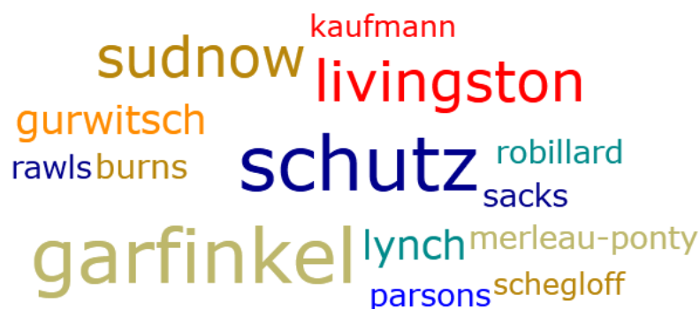
Obrázek č. 1: Nejcitovanější autoři v celém korpusu GEM

Tento celkový pohled na citační odkazy z korpusu GEM vypovídá sice o tom, jací autoři a autorky byli v Garfinkelových textech exponováni, ale zároveň vyvolává další otázky. Zvláště identifikovaná distinkce mezi předchůdci a souputníky vede k pracovní hypotéze, podle níž v první fázi své odborné kariéry čerpal Garfinkel hlavně z děl předchůdců za účelem ustanovení školy etnometodologie a jejích základních principů, aby pak ve druhé fázi kariéry přikročil k propagaci některých proponentů již existujícího „etnometodologického hnutí“ (Flynn 1991), jeho reprodukci a hlubšímu promýšlení etnometodologické perspektivy. Abych tuto možnost blíže prozkoumal, provedl jsem analýzu dvou částí korpusu GEM rozdělených podle data vzniku textu rokem 1967. (Viz tabulku č. 3 a č. 4, resp. obrázek č. 2)